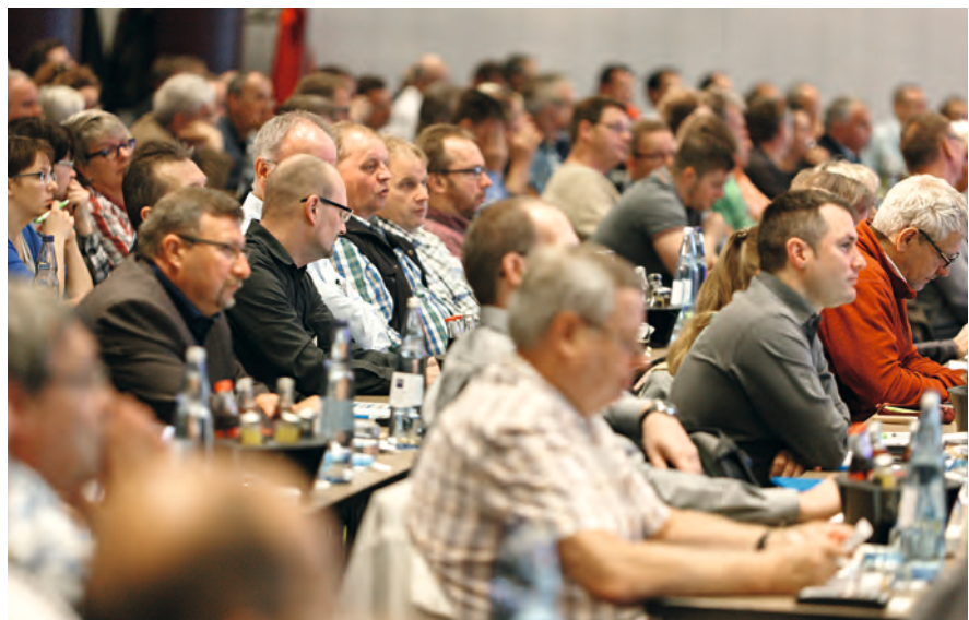
Volles Haus bei der letzten Arbeitsschutztagung 2016

Die Arbeitsschutztagung wird als Unternehmerfortbildung im BGN-Branchenmodell und BGN-Unternehmermodell anerkannt sowie als Fortbildung im Rahmen der Sifa-Ausbildung.